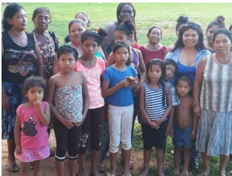
Mulheres e crianças da aldeia Bigiston - 2017

Vi a famosa “Big Storm” que por esse motivo tem o nome da comunidade que significa “Pedra Grande” tem um significado cosmológico para os indígenas. Tem uma relação de espiritualidade forte para os estes povos.