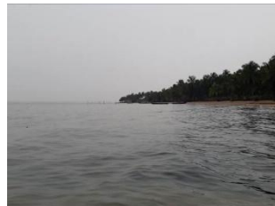
Fonte: Monzilar – Barco transporte para a aldeia Fonte: Monzilar – Rio Marowijne - 2017