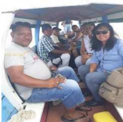
A viagem de Barco -2017

Na viagem fui observando e contemplando a imensidão do rio, as matas a margem, uma paisagem da natureza muito linda. Chegando à aldeia fomos recebidos pelo irmão do Kapitein, em seguida pelos demais indígenas, foi ótimo a recepção, é um lugar muito bonito.