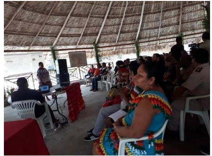
Foto: Monzilar – Reunião comunidade Powaka – Socialização do Projeto - 2017

Fonte : Monzilar – Mulheres Indígenas – 2017 bebida - 2017