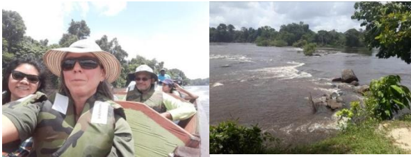
Fonte: Monzilar A viagem de barco -2017- Fonte: Monzilar – O rio Suriname -2017

Gostei muito de conhecer essa comunidade, a forma que eles vivem e como interage ao meio ambiente, recebem os turistas de vários lugares.