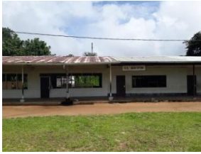
Prédio da escola -2017