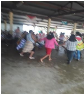
Participação da dança tradicional

Eu participei da dança, me interagi junto com as pessoas que estavam dançando, eu gostei muito, me senti bem e acolhida, principalmente de estar ao meio e vivenciar esse momento, foi uma experiência fantástica. Foram duas danças e duas músicas são: Sambura e Maraká.