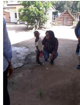
Encontro com o Chefe MarronsCriança Marrons – 2017.

Comunidade Indígena Galibi - 28, 29, 30 /04 e 01 05 017, atividade de campo junto à comunidade indígena Galibi. Localizada na região costeira entre o Rio Marowijne e o Oceano Atlântico, divisa com Guiana Francesa.