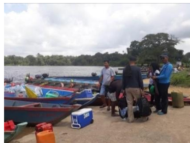
Fonte: Monzilar – Transporte de Barco – 2017 Fonte Monzilar – Embarcando no barco - 2017