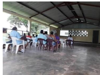
Fonte: Monzilar Eliane – Discurso do Kapitein -2017 Fonte: Monzilar – Salão de Reunião -2017